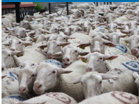
Table Ronde sur les abattoirs (mercredi 9 octobre) :

« Nous voyons enfin pointer à l'horizon un rééquilibrage des aides en faveur de l'élevage, il était grand temps ! ».