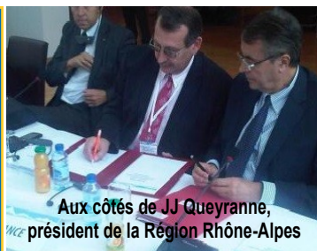
Aux côtés de JJ Queyranne, président de la Région Rhône-Alpes

Les signataires espèrent faire adopter leur projet lors du Conseil Européen de décembre.