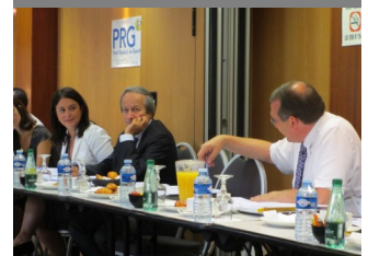
... et Sylvia Pinel

Après avoir débattu de la rentrée politique et des perspectives 2014 en présence de Jean-Michel Baylet, président du PRG, les députés ont reçu Claude Bartolone, président de l'Assemblée Nationale, Sylvia Pinel, ministre de l'Artisanat, du Commerce et du Tourisme, Anne-Marie Escoffier ministre déléguée chargée de la Décentralisation et Bernard Cazeneuve, ministre délégué chargé du Budget, avec lesquels ils ont pu échanger sur des sujets relatifs à leurs missions respectives.