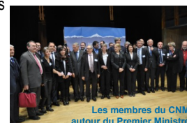
Les membres du CNM autour du Premier Ministre

grands chantiers en cours, à savoir la place de la montagne dans les lois de décentralisation avec comme objectif un renforcement du rôle des massifs et le développement de la stratégie macrorégionale autour de l'Arc Alpin pour favoriser l'émergence d'une Europe des territoires.